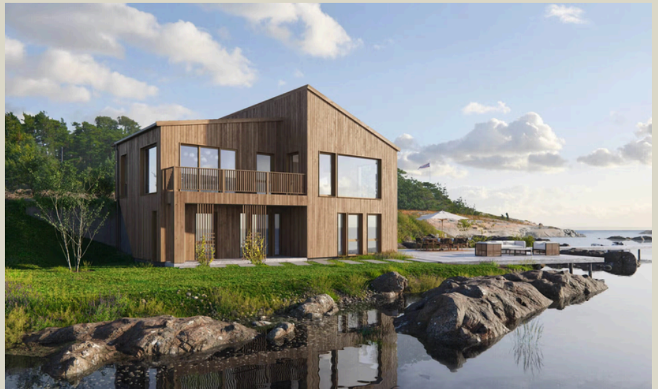
Blink Hus Askøy