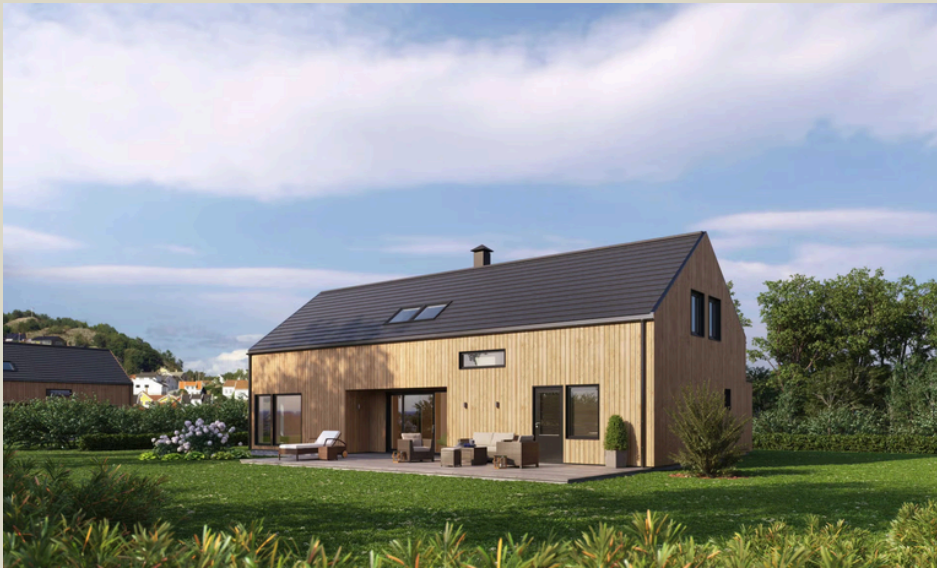
Blink Hus Bryne