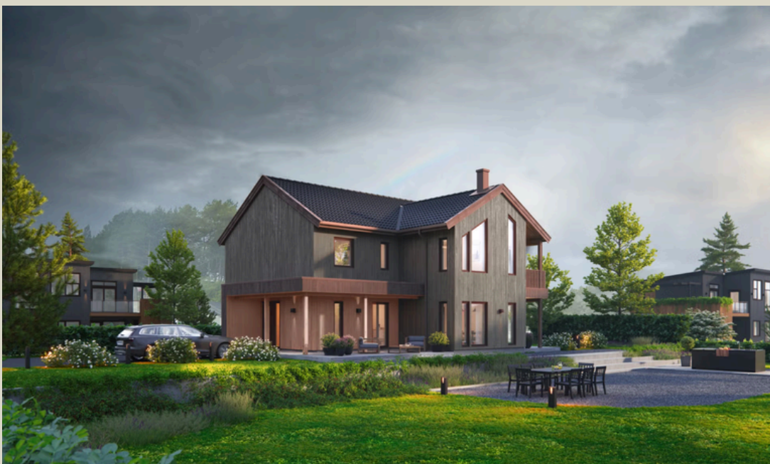
Blink Hus Skien