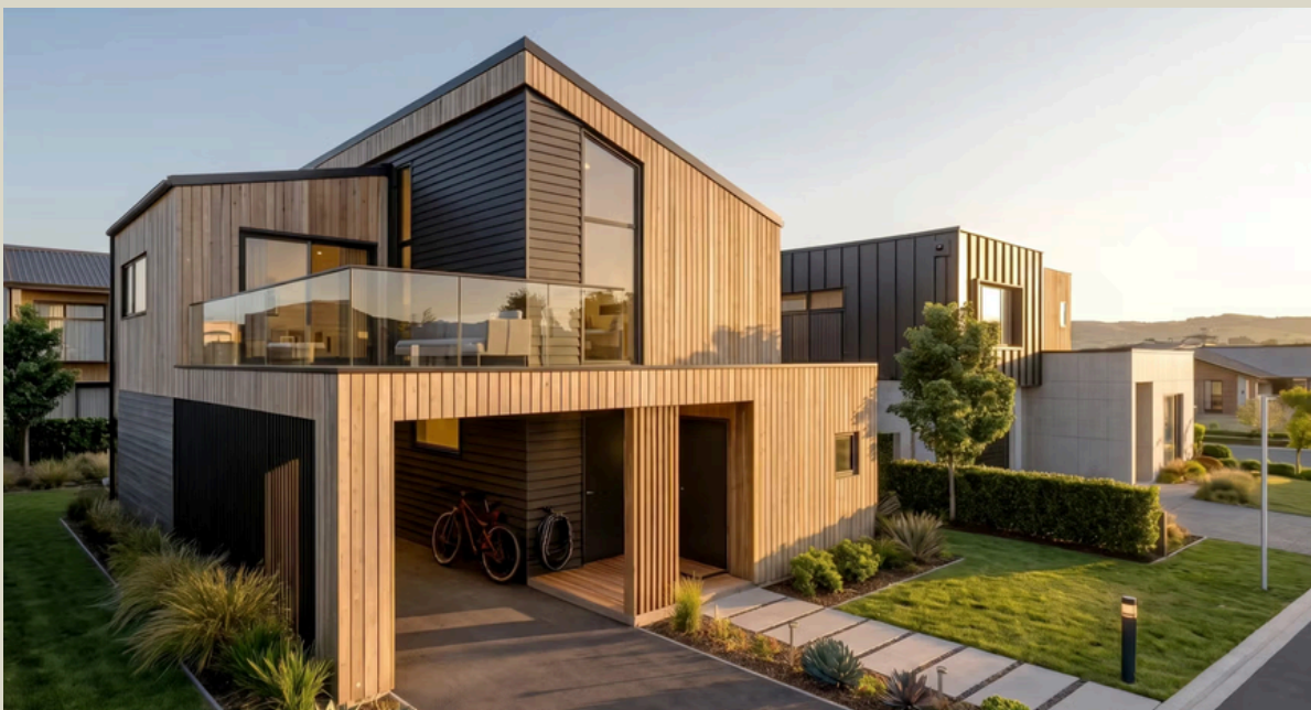
Blink Hus Jessheim

Målet er enkelt: å gi deg størst mogleg valfridom, samtidig som du får tryggleiken og kvaliteten som følgjer med eit profesjonelt gjennomført byggeprosjekt.